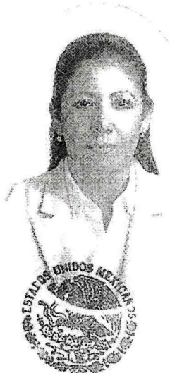
Secretaría de Educación Pública PUEBLA, PUE.

justificó debidamente haber sido aprobada en los exámenes parciales respectivos de todas las materias que la Ley señala para el Grado de Maestría en Innovación Educativa y en el Acto de Recepción de Grado correspondiente sustentado en la Universidad de los Angeles el día 15 de Junio de 2017, según consta en los certificados de estudios y acta existentes en el archivo de la Secretaría de Educación Pública; con fundamento en el Artículo 119 de la Constitución Política del Estado, le expide el presente Grado de